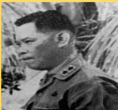
Nguyễn Khoa Nam (1927-1975)

Luật sư Cựu Bộ Trưởng Bộ Thông Tin - Thượng Nghị Sĩ 3/5/75